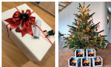
Danke für die tollen Geschenke

Wir wissen es sehr zu schätzen, solch verlässliche und engagierte Partner an unserer Seite zu haben. Vielen Dank für die großartige Unterstützung und die Wertschätzung unserer Arbeit!