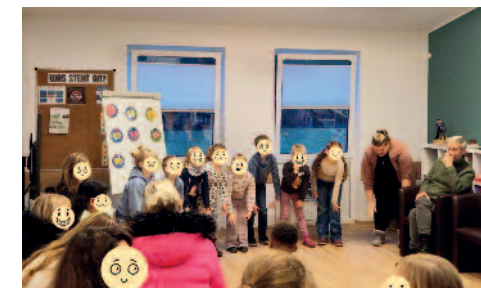
Tag der Kinderrechte: Aufführung der Hortgruppe

Am 20.11. veranstalteten wir zusammen mit der Hortgruppe aus der Kita in Gelbensande und dem Kinder- und Jugendbeirat ein kleines Programm zum Tag der Kinderrechte. Um diesen und seiner Bedeutung gerecht zu werden, überlegten wir gemeinsam mit den Kindern, welche Rechte sie haben, sie einfordern und sich auf keinen