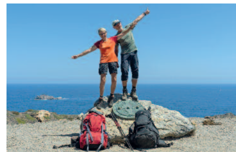
Eine tolle Reise

Am Donnerstag, 15.1. um 19.00 Uhr in der Mensa der Grundschule Rövershagen GR11 – Pyrenäen pur! 850 Kilometer Freiheit! Zu Fuß quer durch die Pyrenäen – von der rauen Atlantikküste