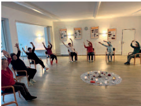
Unsere Seniorinnen bei der Stuhlgymnastik

Wir treffen uns am 8.1. wie gewohnt 14.30 Uhr , um das neue Jahr zu begrüßen und bei einem Spielenachmittag uns auszutauschen. Bringt gute Laune und Ideen für Veranstaltungen im Jahr 2026 mit. Unsere Stuhlgymnastik beginnt wieder voller Elan am 6.1.