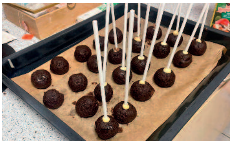
Weihnachtstreff der Jugend: Cake Pops selbst machen

Zusätzlich können wir wenigstens auf die erste der beiden Weihnachtsfeiern für die Kinder und Jugendlichen zurückblicken. Für die Jugendlichen veranstalteten wir ein gemütliches Stelldichein, welches wir als »Weihnachtschillen« bezeichneten. Von Cake Pops selbst machen über Chips bis hin zu selbstgemachter Pizza mit Filmschauen genossen wir die gemeinsame Zeit.