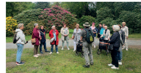
Seniorengruppe beim Ausflug in den Rhododendronpark Graal-Müritz

Vielen Dank an die Erzieher und Kinder, ihr habt uns eine große Freude bereitet.